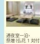
通夜室一泊・祭壇 (仏花1対付)