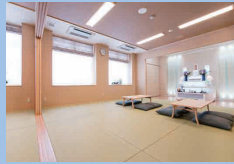
通夜室一泊・祭壇