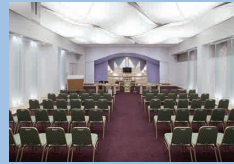
セレモニーホール会場設備 (セレモニーホール中ホール用祭壇・会場費)