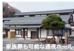
家族葬も可能な通夜ホール 天童会館 つつじ