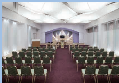
セレモニーホール会場設営 (セレモニーホール中ホール用祭壇・会場費)