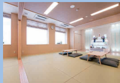
通夜室一泊・祭壇