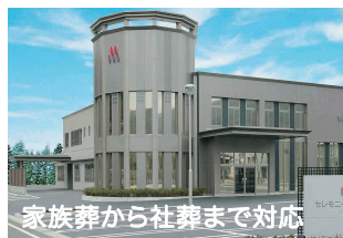
家族葬から社葬まで対応 セレモニーホール天童