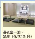
通夜室一泊・ 祭壇(仏花1対付)