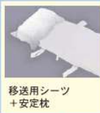
移送用シーツ +安定枕