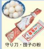
守り刀・団子の粉