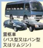
霊柩車 (バス型又はバン型 又はリムジン)