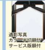
遺影写真 カラー半切額付 サービス版額付