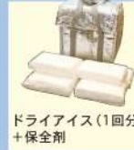
ドライアイス(1回分) +保全剤