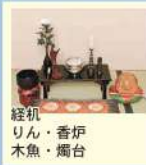
経机 りん・香炉 木魚・燭台